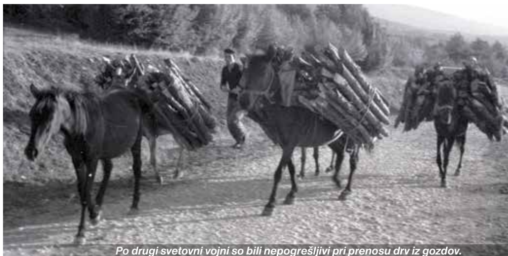
Po drugi svetovni vojni so bili nepogrešljivi pri prenosu drv iz gozdov.

do sedemdesetih let prejšnjega stoletja pomemben izvozni artikel, predvsem v Italijo. V vsaki skupini »samarašev« je bilo od 15 do 20 konj in trije do štirje delavci iz Bosne. Nekaj teh delavcev je delalo kot sezonski delavci, lastniki teh konj in tudi veliko delavcev pa se je za stalno preselilo v Slovenijo in se asimiliralo. Večina bosanskih planinskih konj je v Sloveniji tudi ostala, večji del v lasti priseljenih in asimiliranih Bosancev ali Hercegovcev, ki so bili samarjenja – tovorjenja s temi konji – najbolj večji, nekaj pa so jih pokupili tudi Slovenci in nadaljevali delo v gozdovih, pri oskrbi in gradnji planinskih koč v visokogorju, gradnji