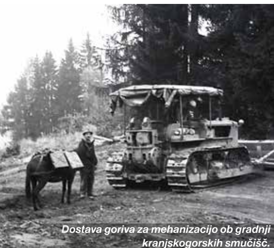
Dostava goriva za mehanizacijo ob gradnji kranjskogorskih smučišč.