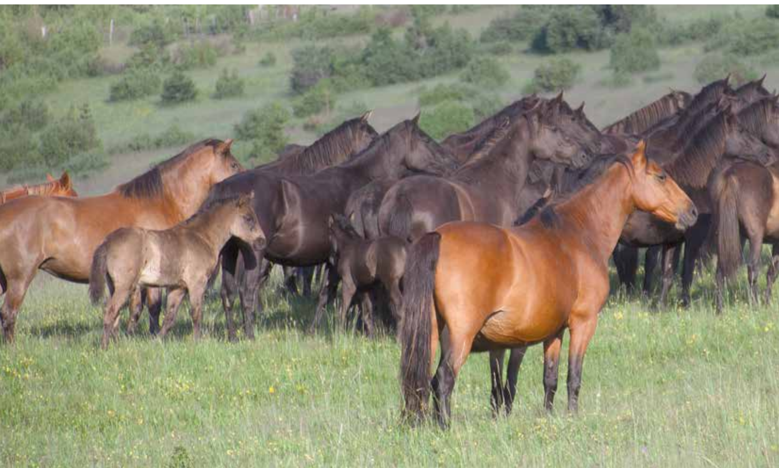
Bosanski planinski konji so se pojavili na naših tleh že v 15. stoletju.

Bosno, ni bila »zaprta« in strogo varovana, trgovanje je bilo živo, prav tako tudi trgovina s planinskimi konji z območja Bosne. Na tisoče bosanskih planinskih konj je bilo v 1. svetovni vojni vključenih v gorsko vojno na zahodni fronti, katere sestavni del je bila soška fronta. Po vojni je v zahodni Sloveniji in tudi v Avstriji na Tirolskem ostalo precejšnje število teh konj, njihovo uporabno vrednost so zelo cenili v hribovitih območjih. Uporaba teh konj v Sloveniji se je še razširila po 1. svetovni vojni, ko je Slovenija postala sestavni del države SHS, kasneje Kraljevine Jugoslavije. Bosanski planinski konji so bili v primerjavi z drugimi težjimi delovnimi konji malemu slovenskemu kmetu lažje dostopni in sorazmerno poceni. Prav tako so ti konji zaradi skromnosti in vzdržljivosti tudi mnogo bolj primerni in vsestransko uporabni za nošenje tovora, vleko in jahanje. Po drugi svetovni vojni se je bosanskim planinskim konjem, ki so jih v manjši meri vzrejali in uporabljali v Sloveniji, dodatno pridružilo še na desetine skupin »samaršev«, ki so v glavnem nosili drva iz težko dostopnih gozdov do bližnjih cest. Drva so bila po drugi svetovni vojni tja